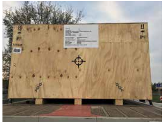
■ Abb. 3.2 Kennzeichnung des Lastschwerpunkts